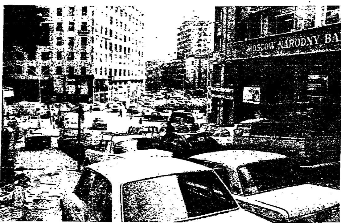
الازدحام في ساحة رياض الصلح.. ومنها يتفرع شارع المصارف